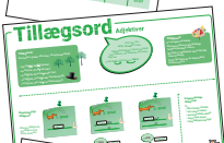
Tillægssord, hvad er det?